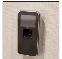
オートロック 指紋認証

本物件は、閑静でありながら、市内中心部にもほど近く、医療施設や商業施設が利用しやすい立地です。また、安心して暮らしていただくために、オートロックには指紋認証などの最新設備を導入し、セキュリティ面も強化しております。