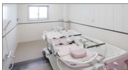
寝たきりでも楽々入浴機械浴「ゲスト」