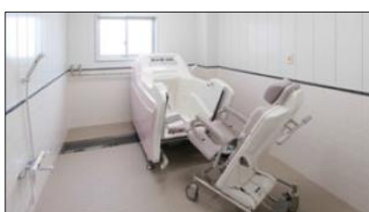
座ったまま入浴できる機械浴「トゥッティ」