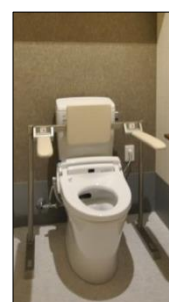
TOTO ベットサイド水洗